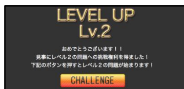
▲「エンジニア検定」レベルアップページ